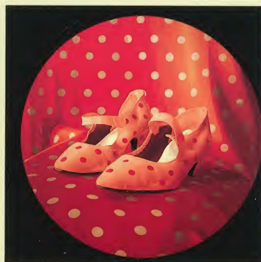
"Homenaje al lunar" de Alfonso Ramírez de Isla. Colección C.A.F.