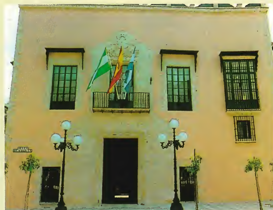
Palacio Pemartín. Sede del Centro Andaluz de Flamenco.

Así, mediante la conservación de aquello que la historia del flamenco nos ha legado en sus doscientos años de vida pública, mediante la divulgación de lo mejor de su producción musical y con el criterio de mantener el más profundo respeto a la tradición, pero a la vez intentando que el pasado desemboque en el futuro, el Centro Andaluz de Flamenco pretende otorgar un tratamiento estelar a este arte de infinita belleza, verdadera joya viva de la cultura de Andalucía.