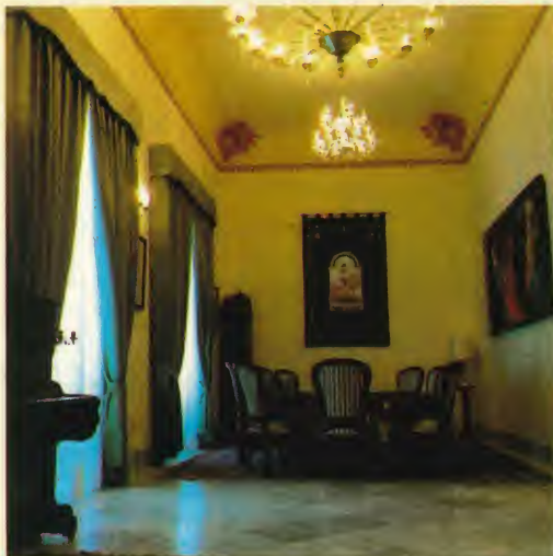
Sala de Juntas.