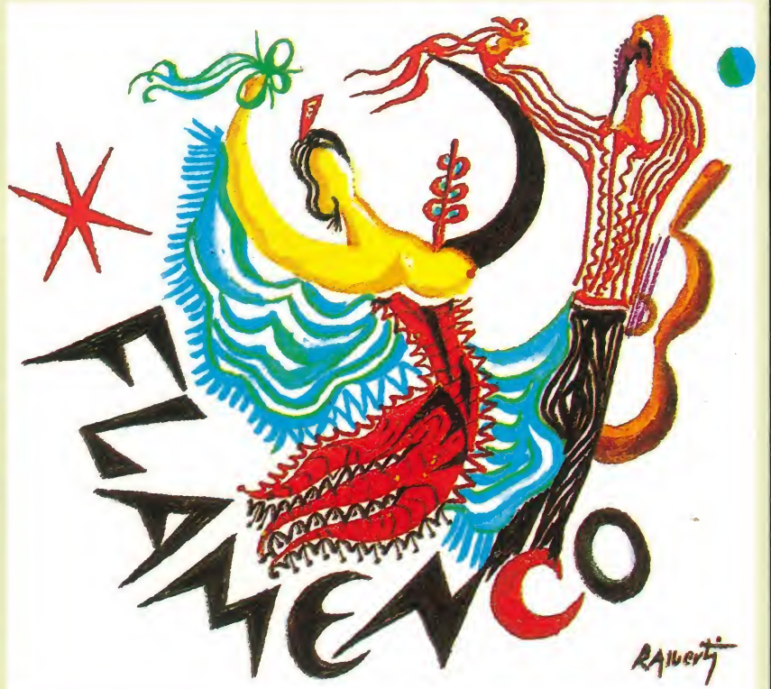
Dibujo de Rafael Alberti. Colección C.A.F.