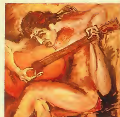
"Guitarrista", de Eloy Rodríguez de Alisal.