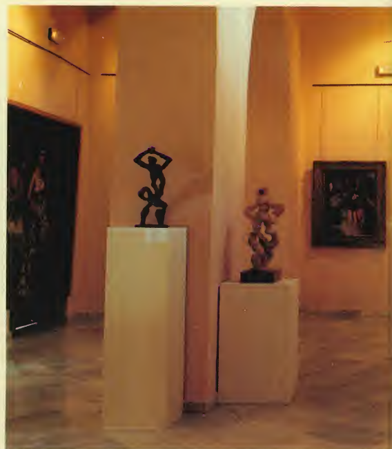
Area 1 de Exposiciones.