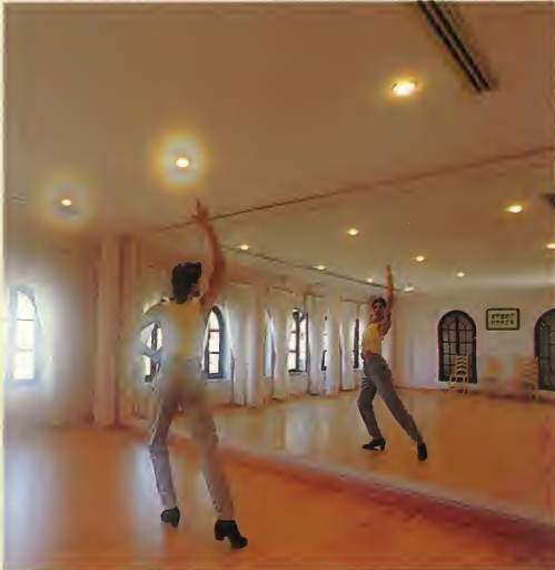
Aula de Baile.