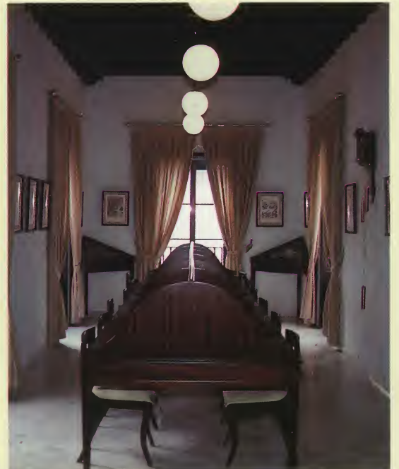
Biblioteca. Sala de lectura.