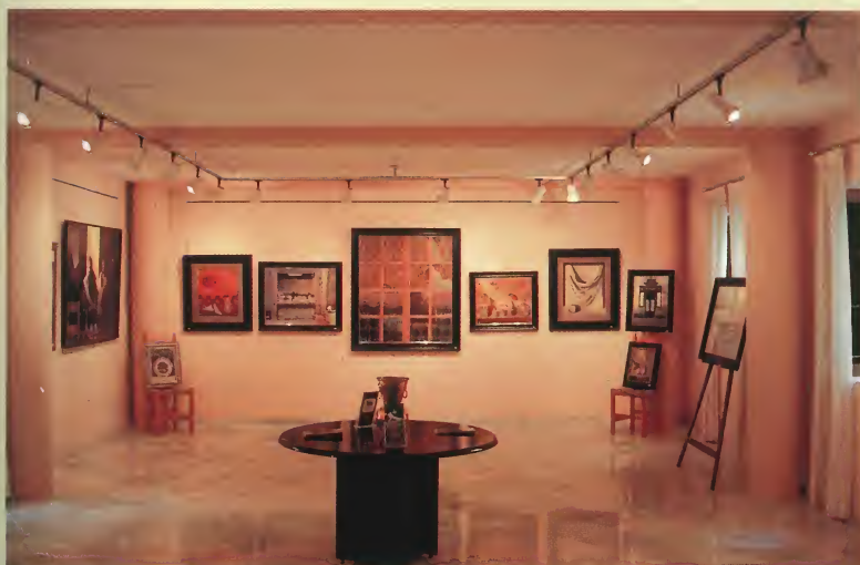
Area 3 de Exposiciones.