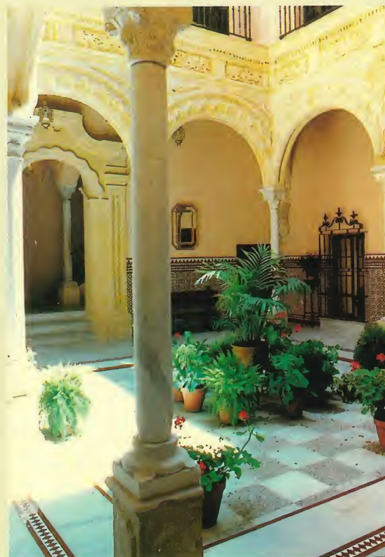
Patio principal. Siglo XVIII.