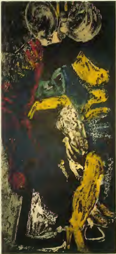
"Sin título" de Dolores Lamamie. Colección C.A.F.