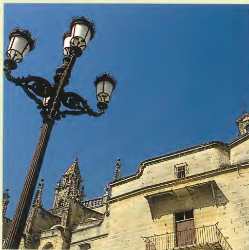
Iglesia de Santiago.