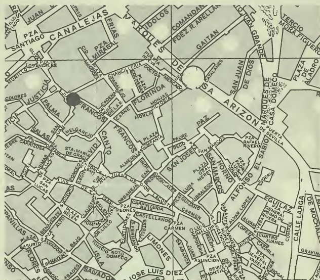
Casco Histórico de Jerez

El programa del Seminario se desarrollará mediante ponencias-coloquio y trabajos en grupo.